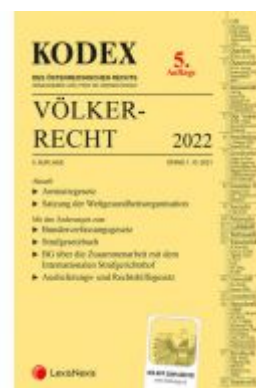
KODEX Völkerrecht 2022 - inkl. App Ladenpreis: 36,00EUR