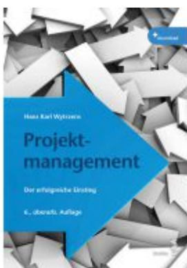
Projektmanagement Ladenpreis: 32,00EUR