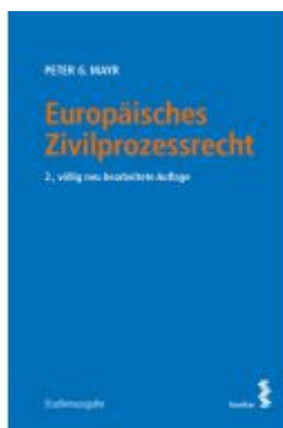
Europäisches Zivilprozessrecht Ladenpreis: 46,00EUR