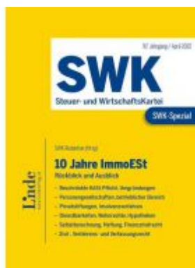
SWK-Spezial 10 Jahre ImmoEST Ladenpreis: 39,00EUR