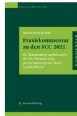
Praxiskommentar zu den SCC 2021 Ladenpreis: 128,00EUR