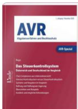
AVR-Spezial Das Steuerkontrollsystem Ladenpreis: 40,00EUR