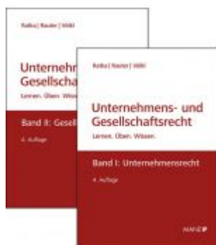
PAKET: Unternehmensrecht + Gesellschaftsrecht Ladenpreis: 97,00EUR