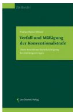
Verfall und Mäßigung der Konventionalstrafe Ladenpreis: 55,00EUR