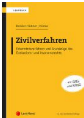
Zivilverfahren Ladenpreis: 66,00EUR

Wir haben andere Produkte gefunden, die Ihnen gefallen könnten!