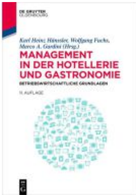
Management in der Hotellerie und Gastronomie Ladenpreis: 49,95EUR