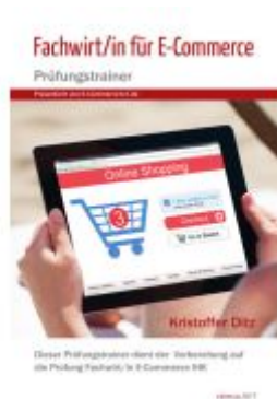
Fachwirt/in E-Commerce – Prüfungstrainer Ladenpreis: 25,70EUR