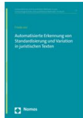
Automatisierte Erkennung von Standardisierung und Variation in juristischen Texten Ladenpreis: 107,00EUR