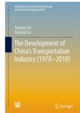
The Development of China's Transportation Industry (1978-2018) Ladenpreis: 186,99EUR