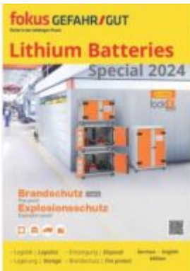
Lithium Batteries Special 2024 Ladenpreis: 21,90EUR