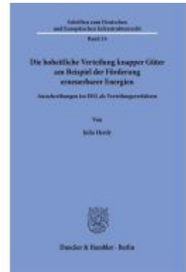
Die hoheitliche Verteilung knapper Güter am Beispiel der Förderung erneuerbarer Energien. Ladenpreis: 102,70EUR