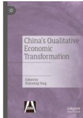
China's Qualitative Economic Transformation Ladenpreis: 142,99EUR