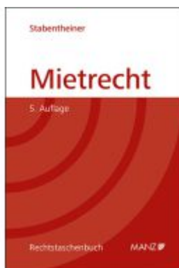
Mietrecht Ladenpreis: 34,00EUR