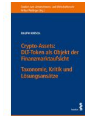
Crypto-Assets: DLT-Token als Objekt der Finanzmarktaufsicht Ladenpreis: 76,00EUR