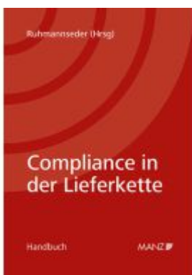
Compliance in der Lieferkette