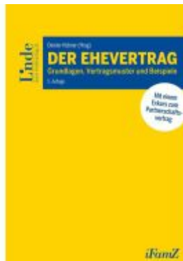
Der Ehevertrag Ladenpreis: 62,00EUR