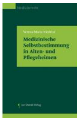
Medizinische Selbstbestimmung in Alten- und Pflegeheimen