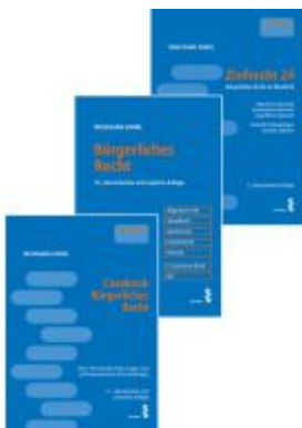
Kombipaket Casebook Bürgerliches Recht, Bürgerliches Recht und Zivilrecht 24