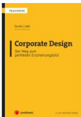
Corporate Design – Der Weg zum perfekten Erscheinungsbild Ladenpreis: 36,00EUR