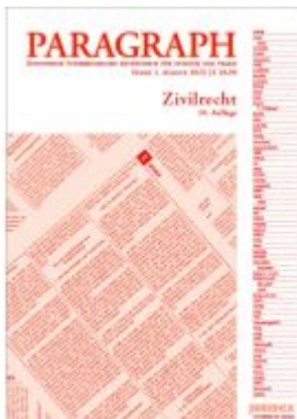
Paragraph - Zivilrecht Ladenpreis: 18,90EUR