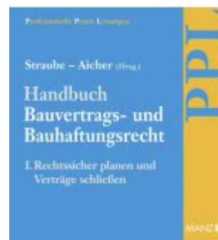
PAKET: Handbuch Bauvertrags- und Bauhaftungsrecht Band I: Rechtssicher Planen