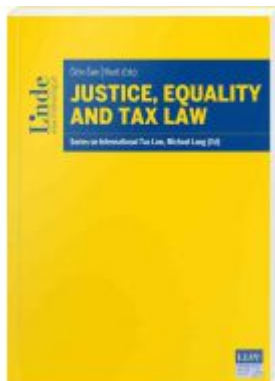
Justice, Equality and Tax Law Ladenpreis: 145,00 EUR