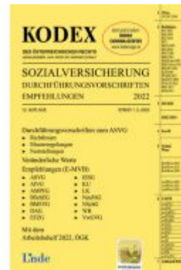
KODEX Sozialversicherung 2022, Band III Ladenpreis: 35,00 EUR