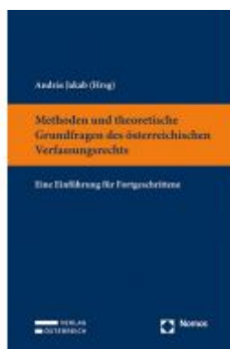
Methoden und theoretische Grundfragen des österreichischen Verfassungsrechts Ladenpreis: 59,00 EUR