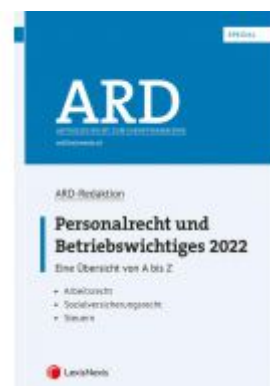
Personalrecht und Betriebswichtiges 2022 Ladenpreis: 82,00 EUR