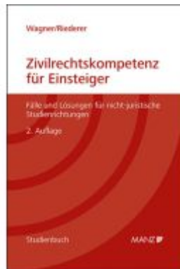
Zivilrechtskompetenz für Einsteiger Fälle und Lösungen für nicht-juristische Studienrichtungen Ladenpreis: 34,40EUR