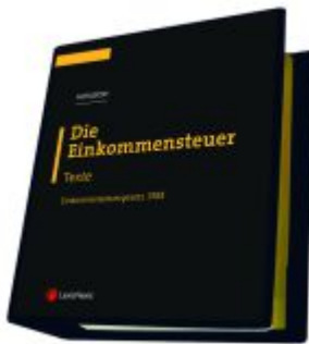
Die Einkommensteuer (ESTG 1988) Band I - Texte Ladenpreis: 298,00EUR

Wir haben andere Produkte gefunden, die Ihnen gefallen könnten!