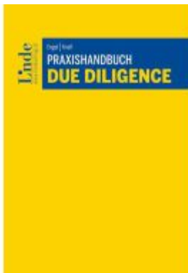
Praxishandbuch Due Diligence Ladenpreis: 68,00EUR