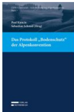
Das Protokoll „Bodenschutz“ der Alpenkonvention Ladenpreis: 45,00EUR