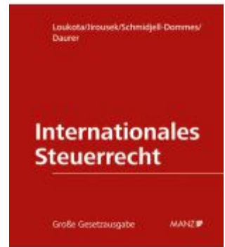
Internationales Steuerrecht Ladenpreis: 498,00EUR