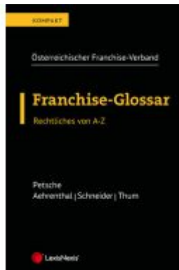
Franchise-Glossar Ladenpreis: 28,00EUR