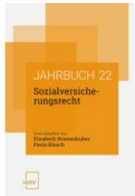
Sozialversicherungsrecht Ladenpreis: 68,00EUR