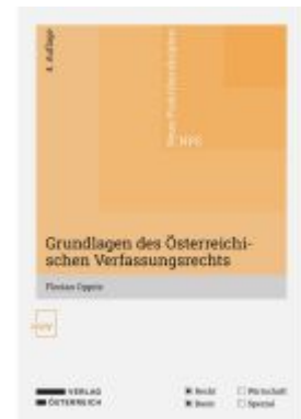
Grundlagen des Österreichischen Verfassungsrechts Ladenpreis: 20,00EUR