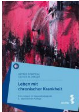
Leben mit chronischer Krankheit Ladenpreis: 24,90EUR