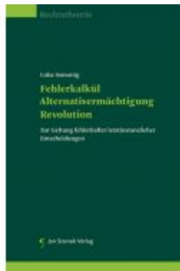
Fehlerkalkül – Alternativvermächti- gung – Revolution Ladenpreis: 39,90EUR