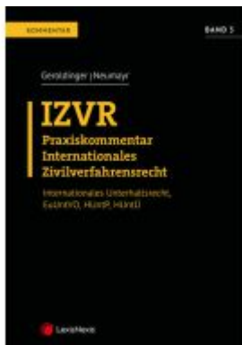
IZVR Praxiskommentar Internationales Zivilverfahrensrecht Ladenpreis: 159,00EUR