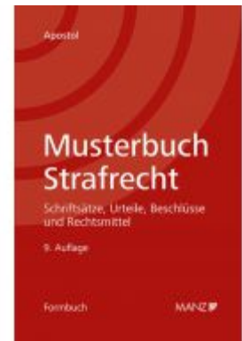
Musterbuch Strafrecht Ladenpreis: 108,00EUR