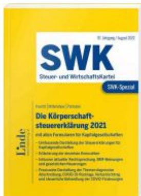
SWK-Spezial Die Körperschaftsteuererklärung 2021 Ladenpreis: 48,00EUR

Wir haben andere Produkte gefunden, die Ihnen gefallen könnten!