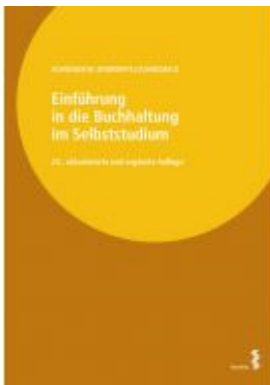
Einführung in die Buchhaltung im Selbststudium Ladenpreis: 52,00EUR