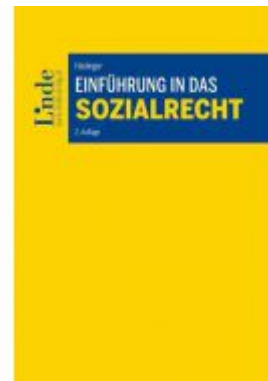
Einführung in das Sozialrecht Ladenpreis: 24,00EUR