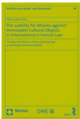
The Liability for Attacks against Immovable Cultural Objects in International Criminal Law Ladenpreis: 132,70EUR