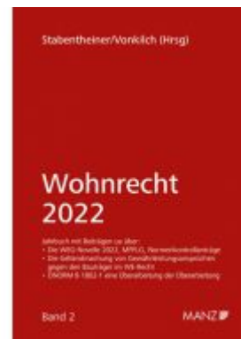
Wohnrecht 2022 Ladenpreis: 46,00EUR