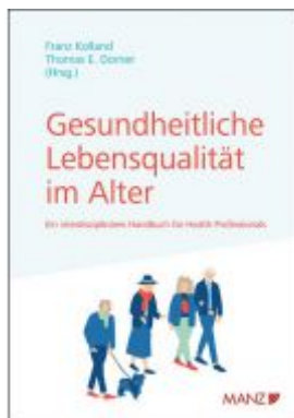
Gesundheitliche Lebensqualität im Alter Ladenpreis: 49,00EUR