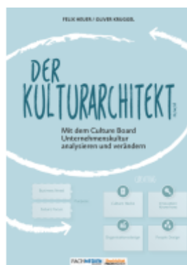
Der Kulturarchitekt Ladenpreis: 47,20EUR