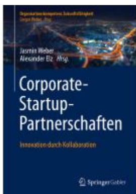
Corporate-Startup-Partnerschaften Ladenpreis: 61,68EUR