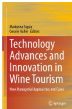
Technology Advances and Innovation in Wine Tourism Ladenpreis: 175,99EUR