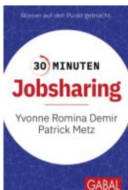
30 Minuten Jobsharing Ladenpreis: 11,30EUR