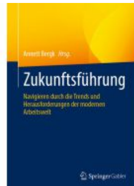
Zukunftsführung Ladenpreis: 51,39EUR