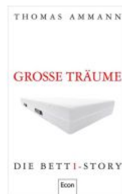
Große Träume Ladenpreis: 25,70EUR