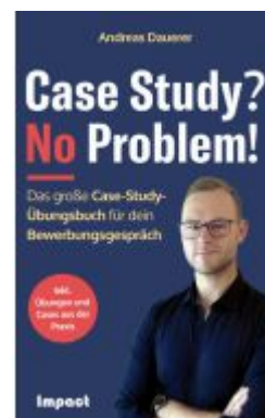
Case Study? No Problem! Ladenpreis: 29,99EUR