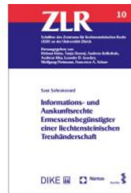
Informations- und Auskunftsrechte Ermessensbegünstigter einer liechtensteinischen Treuhänderschaft Ladenpreis: 92,50EUR