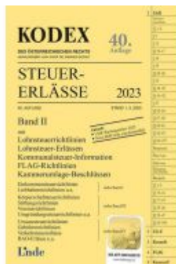
KODEX Steuer-Erlässe 2023, Band II Ladenpreis: 37,00EUR