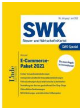
SWK-Spezial E-Commerce-Paket 2021 Ladenpreis: 39,00EUR

Wir haben andere Produkte gefunden, die Ihnen gefallen könnten!