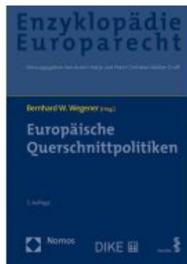
Europäische Querschnittspolitiken Ladenpreis: 174,80EUR