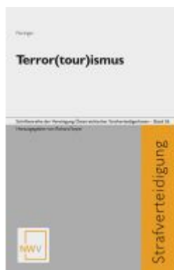
Terror(tour)ismus Ladenpreis: 68,00EUR