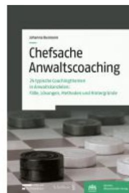
Chefsache Anwaltscoaching Ladenpreis: 83,00EUR