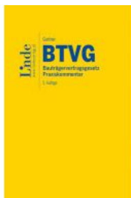
BTVG | Bauträgervertragsgesetz Ladenpreis: 78,00EUR