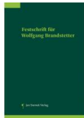
Festschrift für Wolfgang Brandstetter Ladenpreis: 148,00EUR