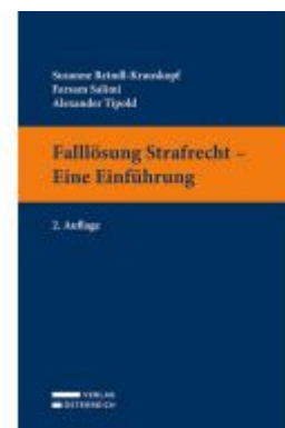
Falllösung Strafrecht - Eine Einführung Ladenpreis: 32,00EUR