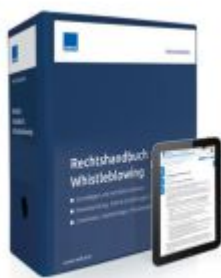
Rechtshandbuch Whistleblowing Ladenpreis: 250,80EUR