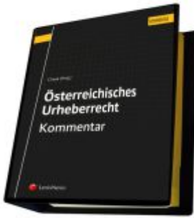
Österreichisches Urheberrecht Ladenpreis: 289,00EUR