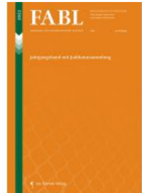
Fremden und Asylrechtliche Blätter (FABL) Ladenpreis: 72,00EUR