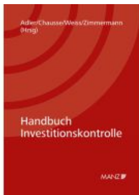
Handbuch Investitionskontrolle Ladenpreis: 112,00EUR