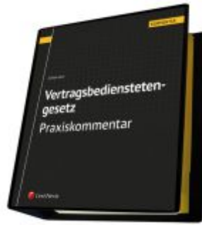
Vertragsbedienstetengesetz - Praxiskommentar Ladenpreis: 330,00EUR