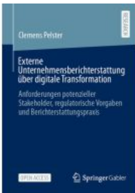
Externe Unternehmensberichterstattung über digitale Transformation Ladenpreis: 43,99EUR