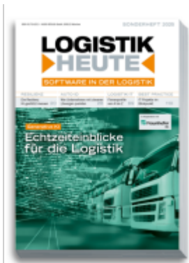
Software in der Logistik 2025 Ladenpreis: 32,80EUR

Wir haben andere Produkte gefunden, die Ihnen gefallen könnten!