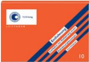
Entlohnung Ladenpreis: 233,64EUR