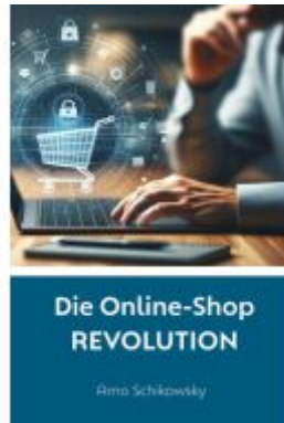
Die Online-Shop REVOLUTION Ladenpreis: 18,50EUR