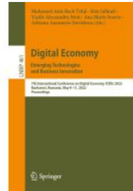
Digital Economy. Emerging Technologies and Business Innovation Ladenpreis: 54,99EUR