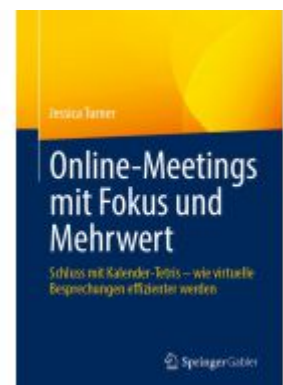
Online-Meetings mit Fokus und Mehrwert Ladenpreis: 41,11EUR