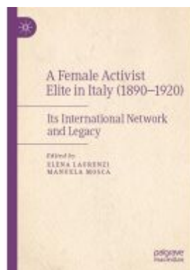
A Female Activist Elite in Italy (1890-1920) Ladenpreis: 164,99EUR