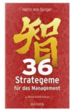
36 Strategeme für das Management Ladenpreis: 36,00EUR