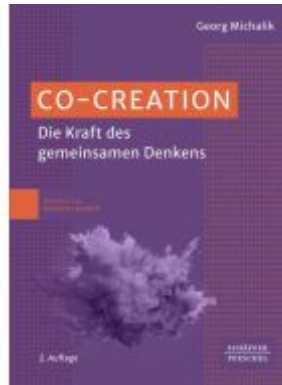
Co-Creation Ladenpreis: 46,30EUR