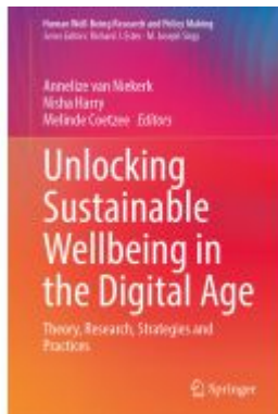
Unlocking Sustainable Wellbeing in the Digital Age Ladenpreis: 186,99EUR

Wir haben andere Produkte gefunden, die Ihnen gefallen könnten!