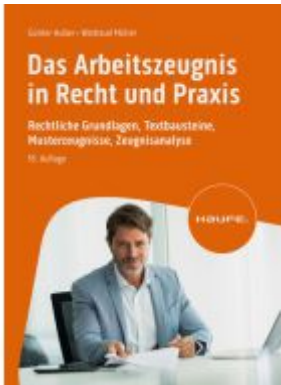
Das Arbeitszeugnis in Recht und Praxis Ladenpreis: 51,40EUR