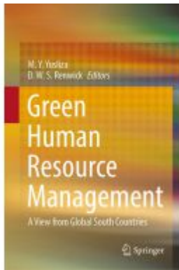
Green Human Resource Management Ladenpreis: 164,99EUR