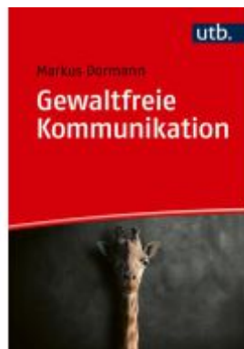
Gewaltfreie Kommunikation Ladenpreis: 20,50EUR