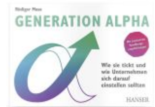
Generation Alpha Ladenpreis: 41,20EUR