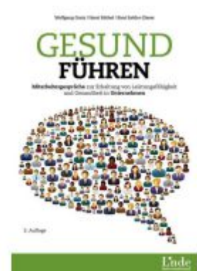
Gesund führen Ladenpreis: 29,90EUR