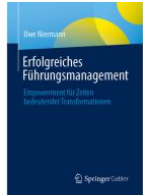
Erfolgreiches Führungsmanagement Ladenpreis: 46,25EUR