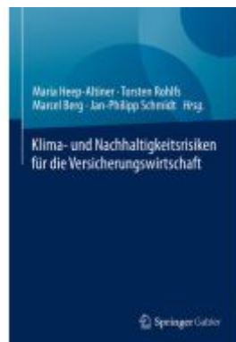
Klima- und Nachhaltigkeitsrisiken für die Versicherungswirtschaft Ladenpreis: 66,81EUR