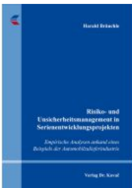
Risiko- und Unsicherheitsmanagement in Serienentwicklungsprojekten Ladenpreis: 154,00EUR