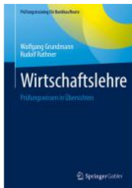
Wirtschaftslehre Ladenpreis: 25,69EUR