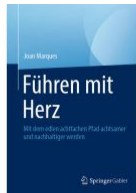
Führen mit Herz Ladenpreis: 39,06EUR