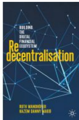
Redecentralisation Ladenpreis: 65,99EUR