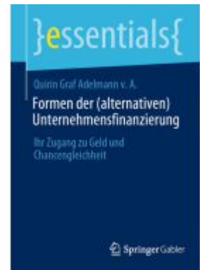
Formen der (alternativen) Unternehmensfinanzierung Ladenpreis: 15,41EUR