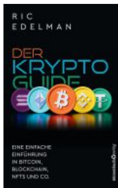
Der Krypto-Guide Ladenpreis: 30,70EUR