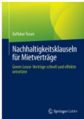
Nachhaltigkeitsklauseln für Mietverträge Ladenpreis: 51,39EUR

Wir haben andere Produkte gefunden, die Ihnen gefallen könnten!