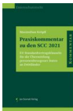
Praxiskommentar zu den SCC 2021 Ladenpreis: 128,00 EUR