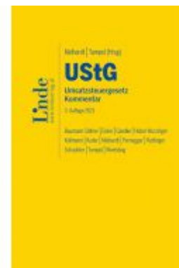
UStG | Umsatzsteuergesetz Ladenpreis: 330,00 EUR