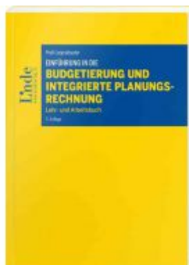
Einführung in die Budgetierung und integrierte Planungsrechnung Ladenpreis: 36,00 EUR