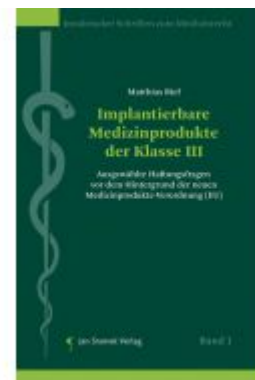
Implantierbare Medizinprodukte der Klasse III Ladenpreis: 68,00 EUR