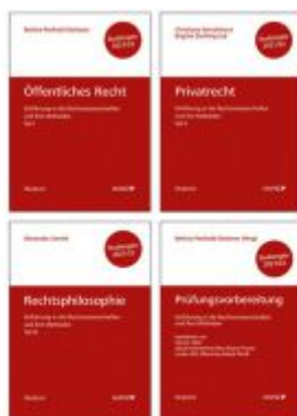
PAKET: Prüfungsvorbereitung + Einführung in die Rechtswissenschaften und ihre Methoden: Tl. I + Tl. II + Tl. III Ladenpreis: 44,00 EUR