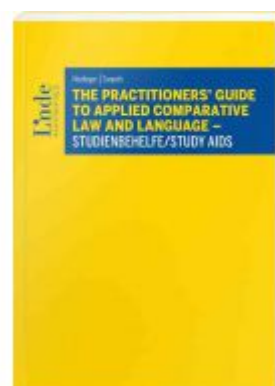
The Practitioners' Guide to Applied Comparative Law and Language - Studienbehelfe/Study Aids Ladenpreis: 49,00 EUR