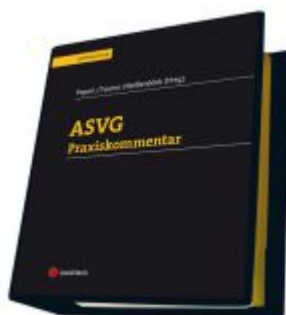
ASVG Praxiskommentar Ladenpreis: 315,00 EUR