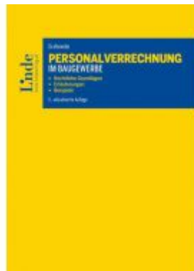
Personalverrechnung im Baugewerbe Ladenpreis: 74,00 EUR