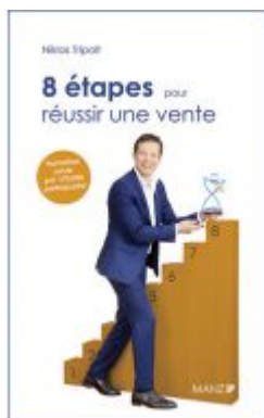
8 étapes pour réussir une vente Ladenpreis: 28,90 EUR