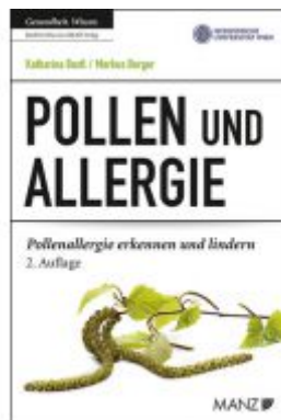
Pollen und Allergie Ladenpreis: 23,90 EUR