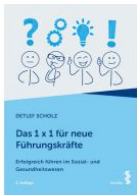
Das 1 x 1 für neue Führungskräfte Ladenpreis: 23,90 EUR