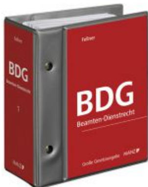
Beamten-Dienstrechtsgesetz Ladenpreis: 332,00 EUR

Wir haben andere Produkte gefunden, die Ihnen gefallen könnten!