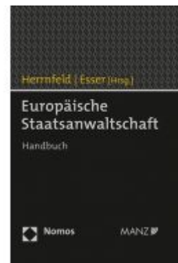
Europäische Staatsanwaltschaft Ladenpreis: 98,00 EUR