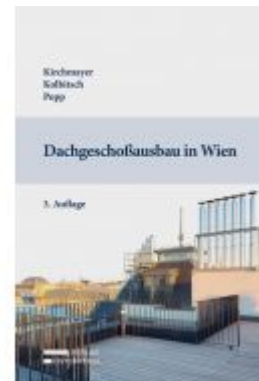
Dachgeschoßausbau in Wien Ladenpreis: 79,00 EUR