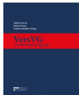
VersVG - Versicherungsvertragsgesetz Ladenpreis: 259,00 EUR