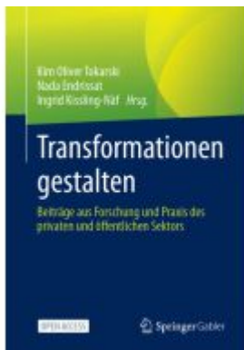
Transformationen gestalten Ladenpreis: 43,99EUR