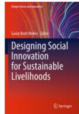
Designing Social Innovation for Sustainable Livelihoods Ladenpreis: 164,99EUR