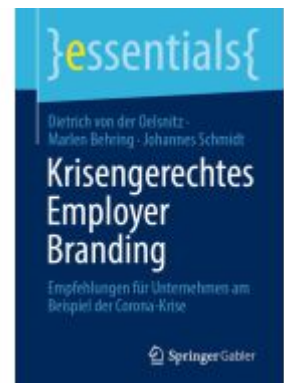
Krisengerechtes Employer Branding Ladenpreis: 15,41EUR