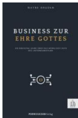
Business zur Ehre Gottes Ladenpreis: 14,40EUR