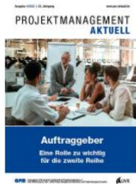
PROJEKTMANAGEMENT AKTUELL 4 (2022) Ladenpreis: 20,60EUR