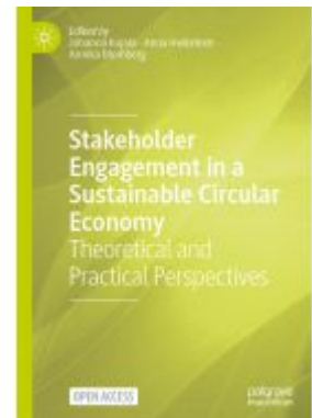
Stakeholder Engagement in a Sustainable Circular Economy Ladenpreis: 54,99EUR