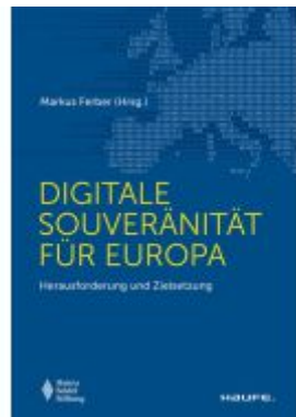
Digitale Souveränität für Europa Ladenpreis: 41,20EUR