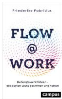
Flow@Work Ladenpreis: 26,90EUR