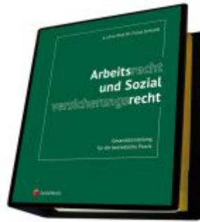
Arbeitsrecht und Sozialversicherungsrecht Ladenpreis: 373,00EUR