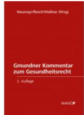
Grundriss des Gesundheitsrechts Ladenpreis: 528,00EUR