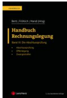
Handbuch Rechnungslegung / Handbuch Rechnungslegung, Band III: Die Abschlussprüfung Ladenpreis: 110,00EUR