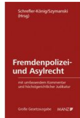
Fremdenpolizei- und Asylrecht Ladenpreis: 235,00EUR