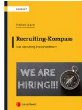
Recruiting-Kompass Ladenpreis: 20,00EUR