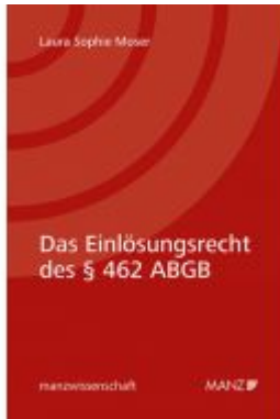
Das Einlösungsrecht des § 462 ABGB Ladenpreis: 59,00EUR

Wir haben andere Produkte gefunden, die Ihnen gefallen könnten!