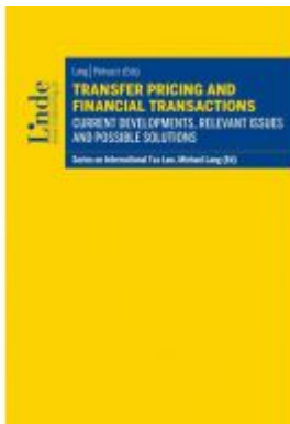
Transfer Pricing and Financial Transactions Ladenpreis: 45,00EUR