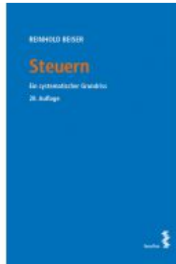
Steuern Ladenpreis: 50,00EUR