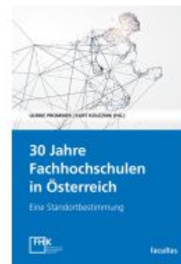
30 Jahre Fachhochschulen in Österreich Ladenpreis: 30,00EUR