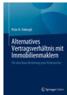
Alternatives Vertragsverhältnis mit Immobilienmaklern Ladenpreis: 66,81EUR