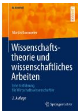
Wissenschaftstheorie und wissenschaftliches Arbeiten Ladenpreis: 20,51EUR