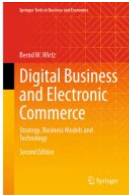
Digital Business and Electronic Commerce Ladenpreis: 153,99EUR