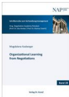
Organizational Learning from Negotiations Ladenpreis: 90,30EUR