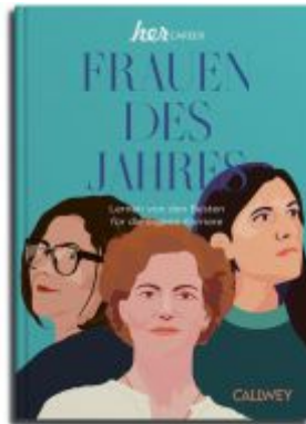
Frauen des Jahres 2023 Ladenpreis: 41,10EUR