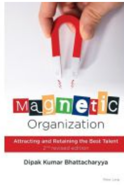
Magnetic Organization Ladenpreis: 61,20EUR