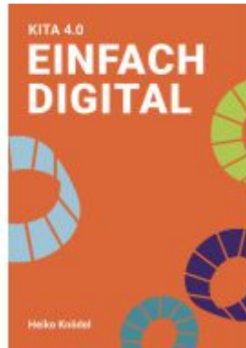
Kita 4.0 – einfach digital Ladenpreis: 20,60EUR