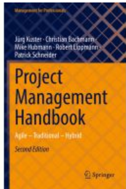
Project Management Handbook Ladenpreis: 87,99EUR