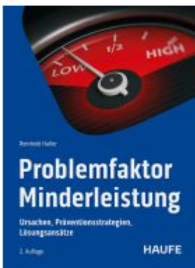
Problemfaktor Minderleistung Ladenpreis: 51,40EUR