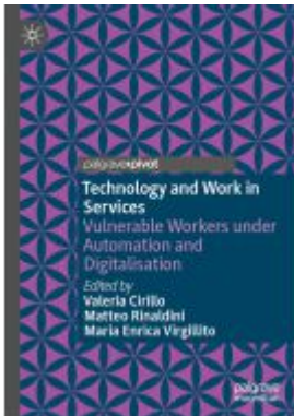
Technology and Work in Services Ladenpreis: 43,99EUR

Wir haben andere Produkte gefunden, die Ihnen gefallen könnten!