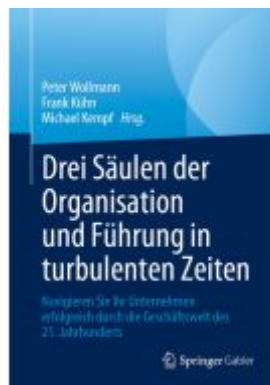
Drei Säulen der Organisation und Führung in turbulenten Zeiten Ladenpreis: 71,95EUR