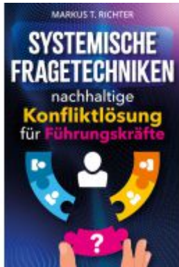
Systemische Fragetechniken - nachhaltige Konfliktlösung für Führungskräfte Ladenpreis: 17,50EUR