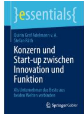
Konzern und Start-up zwischen Innovation und Funktion Ladenpreis: 15,41EUR