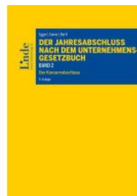
Der Jahresabschluss nach dem Unternehmensgesetzbuch, Band 2 Ladenpreis: 90,00EUR