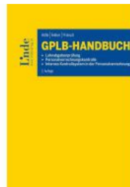
GPLB-Handbuch Ladenpreis: 66,00EUR