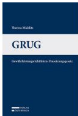
GRUG Ladenpreis: 39,00EUR

Wir haben andere Produkte gefunden, die Ihnen gefallen könnten!