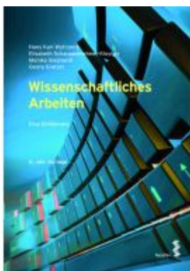
Wissenschaftliches Arbeiten Ladenpreis: 22,00EUR