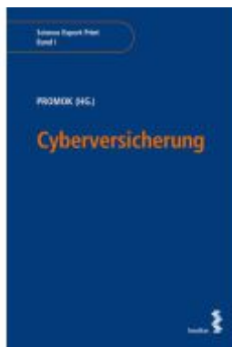
Cyberversicherung Ladenpreis: 36,00EUR