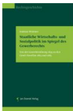
Staatliche Wirtschafts- und Sozialpolitik im Spiegel des Gewerberechts Ladenpreis: 49,90EUR