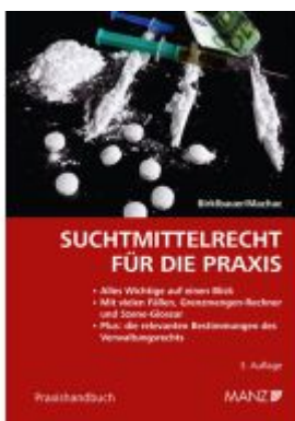
Suchtmittelrecht für die Praxis Ladenpreis: 32,00EUR