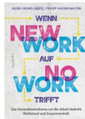
Wenn new work auf no work trifft Ladenpreis: 19,00EUR