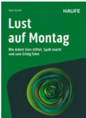
Lust auf Montag Ladenpreis: 30,90EUR