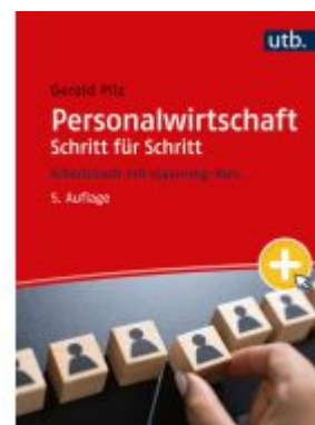
Personalwirtschaft Schritt für Schritt Ladenpreis: 33,90EUR