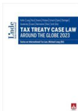
Tax Treaty Case Law around the Globe 2023 Ladenpreis: 95,00EUR