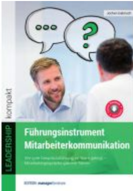
Führungsinstrument Mitarbeiterkommunikation Ladenpreis: 25,60EUR