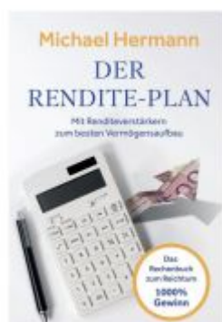
Der Rendite-Plan Ladenpreis: 15,40EUR