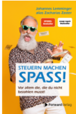
Steuern machen Spaß Ladenpreis: 24,90EUR