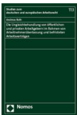
Die Ungleichbehandlung von öffentlichen und privaten Arbeitgebern im Rahmen von Arbeitnehmerüberlassung und befristeten Arbeitsverträgen