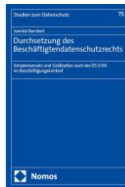
Durchsetzung des Beschäftigendatenschutzrechts Ladenpreis: 245,70EUR