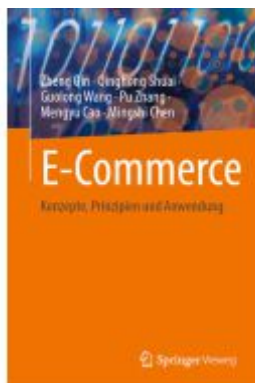
E-Commerce Ladenpreis: 51,39EUR