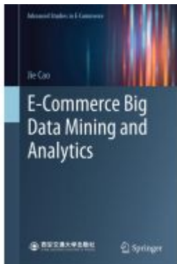
E-Commerce Big Data Mining and Analytics Ladenpreis: 71,49EUR