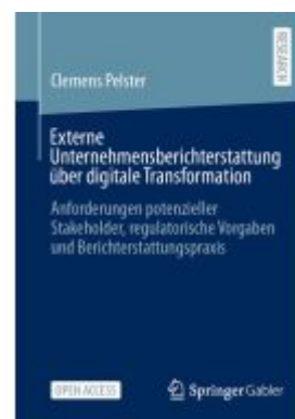
Externe Unternehmensberichterstattung über digitale Transformation