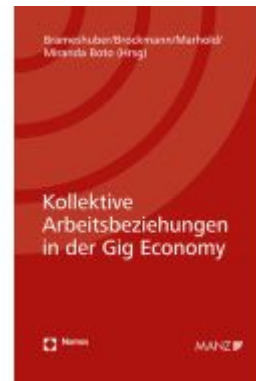
Kollektive Arbeitsbeziehungen in der Gig Economy Ladenpreis: 64,00EUR