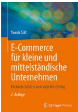
E-Commerce für kleine und mittelständische Unternehmen Ladenpreis: 35,97EUR