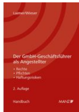
Der GmbH-Geschäftsführer als Angestellter Ladenpreis: 46,00EUR