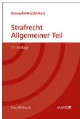
Grundriss des Strafrechts Allgemeiner Teil Ladenpreis: 72,00EUR

Wir haben andere Produkte gefunden, die Ihnen gefallen könnten!