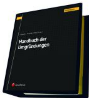
Handbuch der Umgründungen Ladenpreis: 535,00EUR