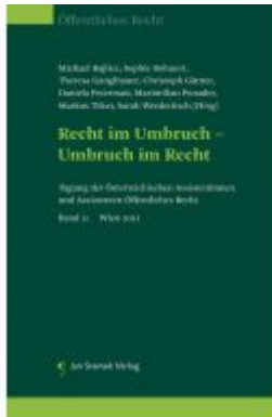
Recht im Umbruch - Umbruch im Recht Ladenpreis: 85,00EUR