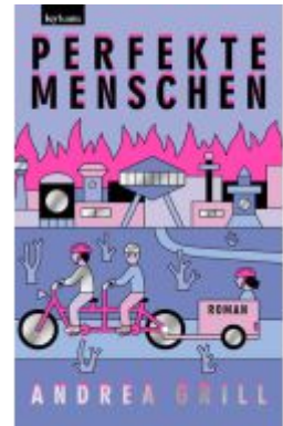
Perfekte Menschen Ladenpreis: 24,50EUR