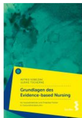
Grundlagen des Evidence-based Nursing Ladenpreis: 26,90EUR