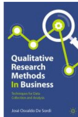
Qualitative Research Methods In Business Ladenpreis: 49,49EUR