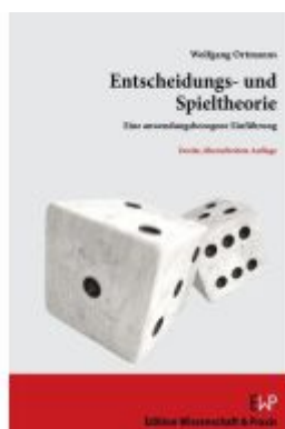
Entscheidungs- und Spieltheorie. Ladenpreis: 30,80EUR