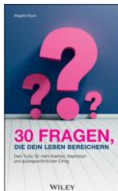
30 Fragen, die dein Leben bereichern Ladenpreis: 20,60EUR