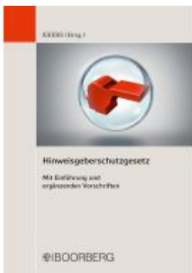
Hinweisgeberschutzgesetz Ladenpreis: 14,40EUR