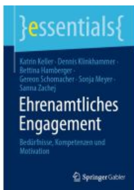
Ehrenamtliches Engagement Ladenpreis: 15,41EUR