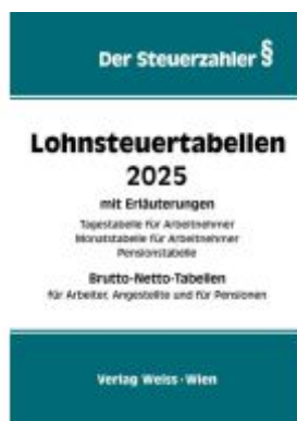
Lohnsteuertabellen 2025 Ladenpreis: 41,80EUR