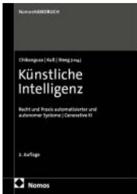
Künstliche Intelligenz Ladenpreis: 173,80EUR

Wir haben andere Produkte gefunden, die Ihnen gefallen könnten!