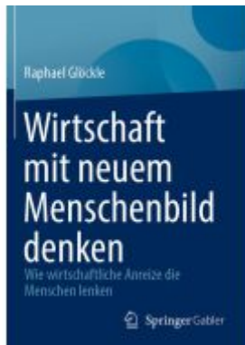
Wirtschaft mit neuem Menschenbild denken Ladenpreis: 56,53EUR