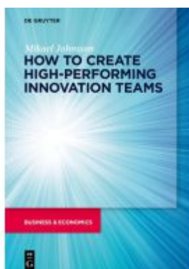
How to create high-performing innovation teams Ladenpreis: 39,95EUR