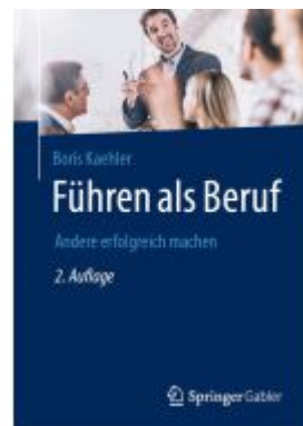
Führen als Beruf Ladenpreis: 51,39EUR