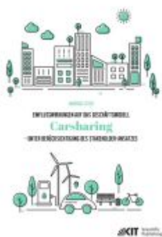
Einflusswirkungen auf das Geschäftsmodell Carsharing – unter Berücksichtigung des Stakeholder- Ansatzes Ladenpreis: 70,00EUR