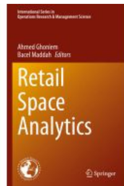
Retail Space Analytics Ladenpreis: 175,99EUR