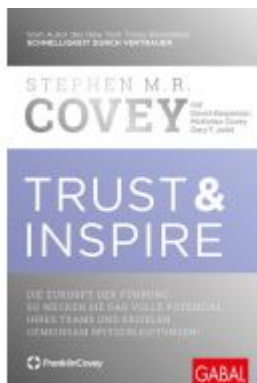
Trust & Inspire Ladenpreis: 35,90EUR

Wir haben andere Produkte gefunden, die Ihnen gefallen könnten!