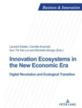
Innovation Ecosystems in the New Economic Era Ladenpreis: 56,10EUR