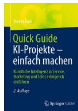
Quick Guide KI-Projekte – einfach machen Ladenpreis: 30,83EUR