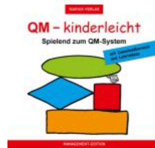
QM - kinderleicht / Spielend zum QM- System Ladenpreis: 100,80EUR