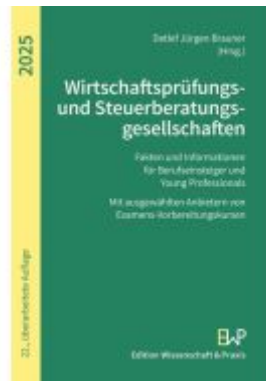
Wirtschaftsprüfungs- und Steuerberatungsgesellschaften 2025 Ladenpreis: 25,60EUR