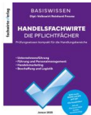
Handelsfachwirte - Die Zusammenfassung Ladenpreis: 28,80EUR