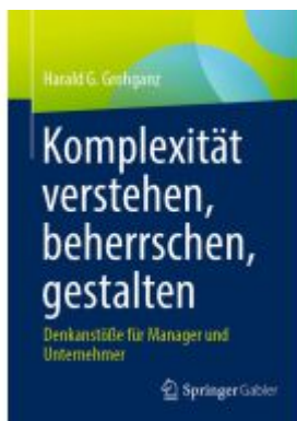
Komplexität verstehen, beherrschen, gestalten Ladenpreis: 41,11EUR