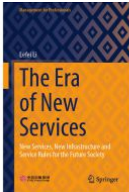
The Era of New Services Ladenpreis: 164,99EUR

Wir haben andere Produkte gefunden, die Ihnen gefallen könnten!