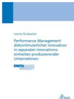
Performance Management diskontinuierlicher Innovation in separaten Innovationseinheiten produzierender Unternehmen Ladenpreis: 55,60EUR