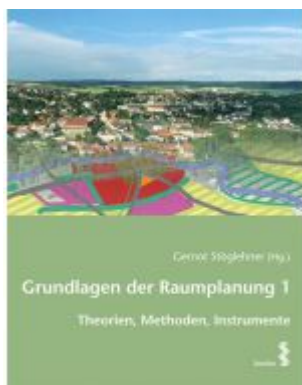
Grundlagen der Raumplanung 1