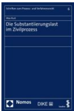
Die Substantiierungslast im Zivilprozess