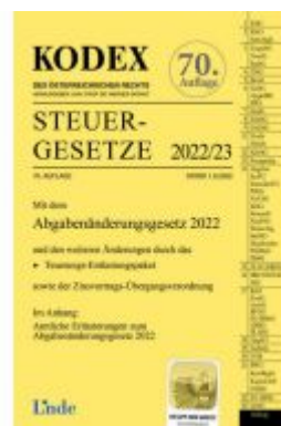
KODEX Steuergesetze 2022/23 Ladenpreis: 40,00 EUR