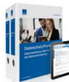
Datenschutz-Praxis Ladenpreis: 239,80 EUR