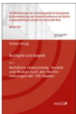
Buchgeld und Bargeld - Teil 1: Rechtliche Unterschiede und Risiken nach den Rechtsordnungen der CEE-Staaten Ladenpreis: 64,00 EUR