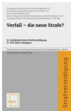
Verfall - die neue Strafe?