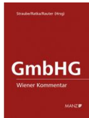
Wiener Kommentar zum GmbH-Gesetz