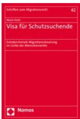
Visa für Schutzsuchende Ladenpreis: 127,50EUR