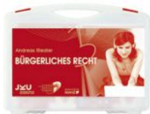
Medienkoffer Bürgerliches Recht Ladenpreis: 322,30 EUR