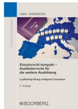
Einsatzrecht kompakt - Ausländerrecht für die weitere Ausbildung Ladenpreis: 18,50EUR