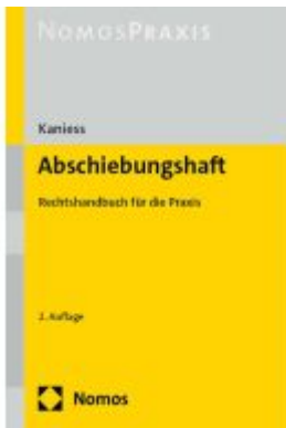
Abschiebungshaft Ladenpreis: 60,70EUR