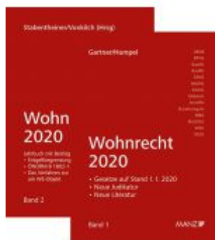
PAKET: Wohnrecht 2020 Band 1 + 2 Ladenpreis: 74,00 EUR