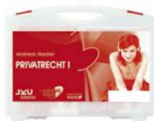
Medienkoffer Privatrecht I Ladenpreis: 259,60 EUR