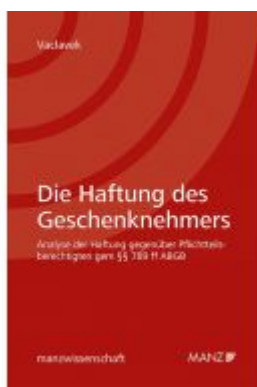
Die Haftung des Geschenknehmers gegenüber dem Pflichtteilsberechtigten Ladenpreis: 59,00 EUR