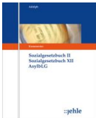
SGB II SGB XII Asylbewerberleistungsgesetz Ladenpreis: 475,00EUR