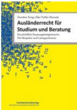
Ausländerrecht für Studium und Beratung Ladenpreis: 37,10EUR