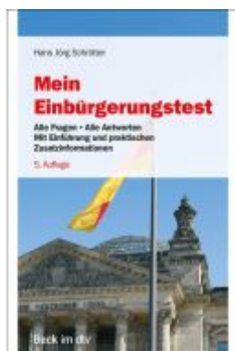
Mein Einbürgerungstest Ladenpreis: 17,40EUR