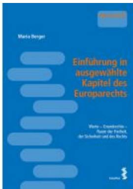
Einführung in ausgewählte Kapitel des Europarechts Ladenpreis: 16,00 EUR