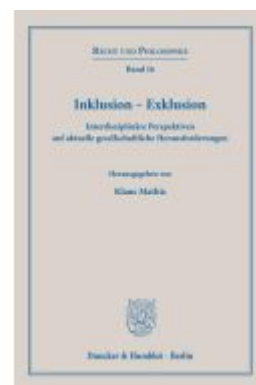
Inklusion - Exklusion Ladenpreis: 102,70EUR