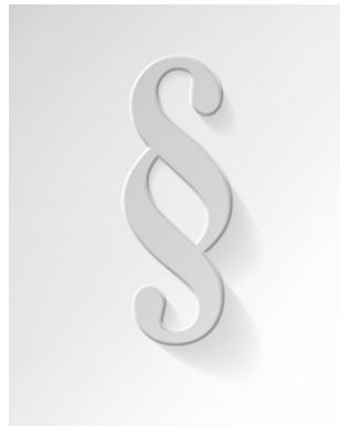
Ausländerrecht Ladenpreis: 194,30EUR