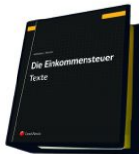
Die Einkommensteuer (EStG 1988) Band I - Texte Ladenpreis: 287,00 EUR