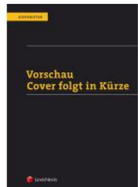
ABGB Praxiskommentar / ABGB Praxiskommentar - Band 6, 5. Auflage Aktionspreis: 158,40 EUR Ladenpreis: 198,00 EUR