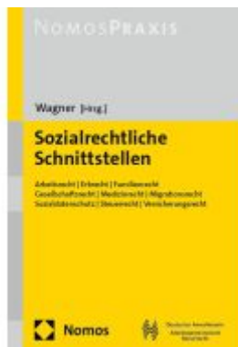
Sozialrechtliche Schnittstellen Ladenpreis: 71,00EUR