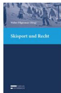
Skisport und Recht Ladenpreis: 75,00 EUR