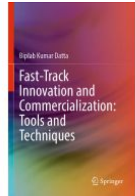
Fast-Track Innovation and Commercialization: Tools and Techniques Ladenpreis: 65,99EUR