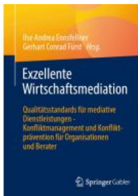
Exzellente Wirtschaftsmediation Ladenpreis: 35,97EUR