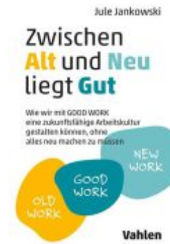
Zwischen Alt und Neu liegt Gut Ladenpreis: 27,70EUR