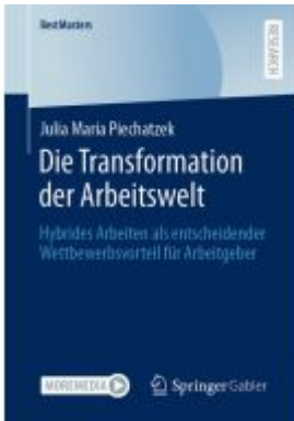
Die Transformation der Arbeitswelt Ladenpreis: 61,67EUR