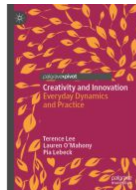
Creativity and Innovation Ladenpreis: 49,49EUR