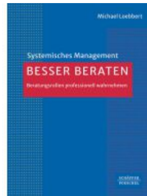
Besser beraten Ladenpreis: 41,20EUR