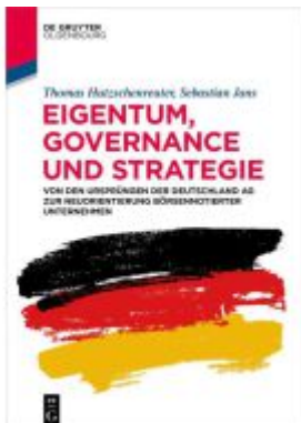
Eigentum, Governance und Strategie Ladenpreis: 34,95EUR

Wir haben andere Produkte gefunden, die Ihnen gefallen könnten!