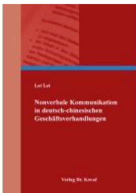
Nonverbale Kommunikation in deutsch- chinesischen Geschäftsverhandlungen Ladenpreis: 100,70EUR