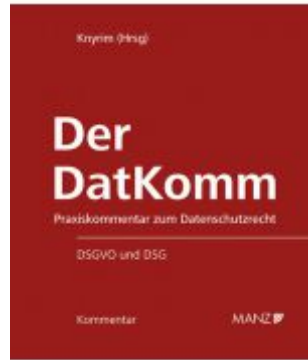
Der DatKomm Ladenpreis: 248,00EUR