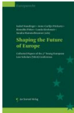
Shaping the Future of Europe Ladenpreis: 74,00EUR