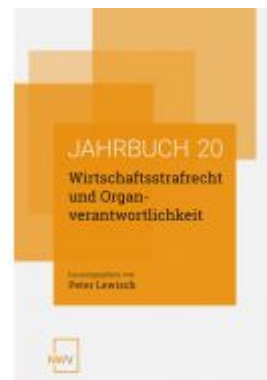
Wirtschaftsstrafrecht und Organverantwortlichkeit Ladenpreis: 58,00EUR