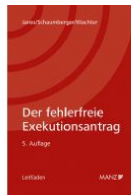
Der fehlerfreie Exekutionsantrag 5. Auflage Ladenpreis: 56,00EUR