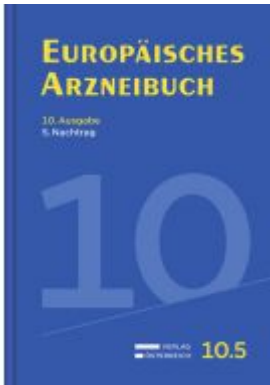
Europäisches Arzneibuch Ladenpreis: 46,67EUR