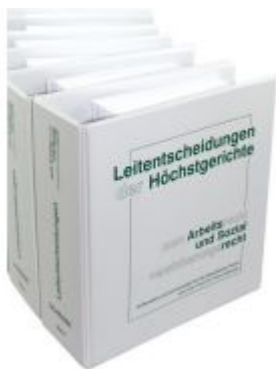
Leitentscheidungen der Höchstgerichte zum Arbeitsrecht und Sozialversicherungsrecht Ladenpreis: 1.360,00EUR

Wir haben andere Produkte gefunden, die Ihnen gefallen könnten!