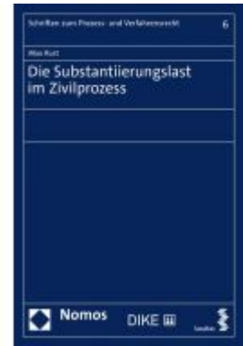
Die Substantiierungslast im Zivilprozess Ladenpreis: 55,60EUR