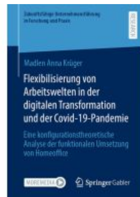
Flexibilisierung von Arbeitswelten in der digitalen Transformation und der Covid-19- Pandemie Ladenpreis: 82,24EUR