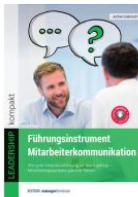
Führungsinstrument Mitarbeiterkommunikation Ladenpreis: 25,60EUR