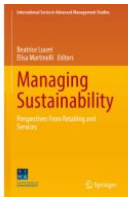
Managing Sustainability Ladenpreis: 109,99EUR