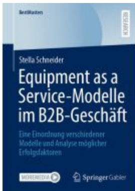
Equipment as a Service-Modelle im B2B-Geschäft

Wir haben andere Produkte gefunden, die Ihnen gefallen könnten!