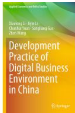
Development Practice of Digital Business Environment in China