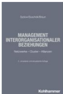
Management interorganisationaler Beziehungen