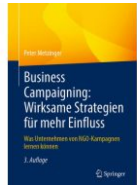
Business Campaigning: Wirksame Strategien für mehr Einfluss