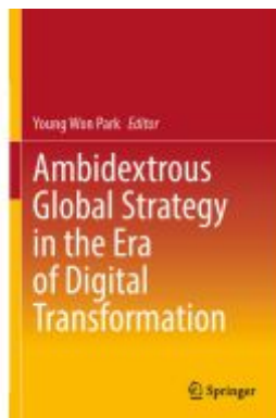
Ambidextrous Global Strategy in the Era of Digital Transformation Ladenpreis: 175,99EUR