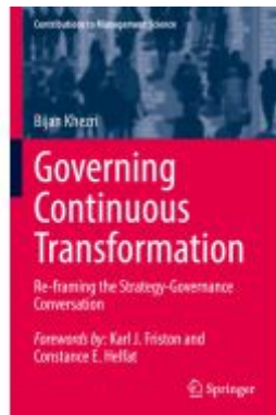
Governing Continuous Transformation Ladenpreis: 120,99EUR