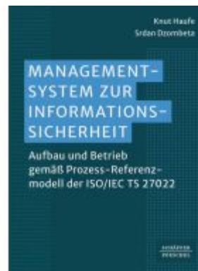
Managementsystem zur Informationssicherheit Ladenpreis: 61,70EUR