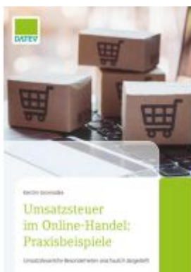
Umsatzsteuer im Online-Handel: Praxisbeispiele Ladenpreis: 22,66EUR