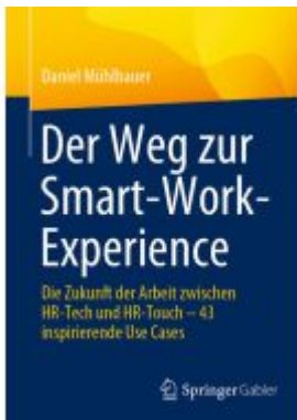
Der Weg zur Smart-Work-Experience Ladenpreis: 39,06EUR

Wir haben andere Produkte gefunden, die Ihnen gefallen könnten!