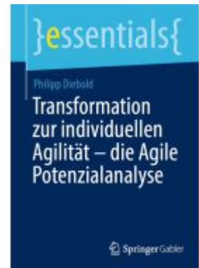
Transformation zur individuellen Agilität – die Agile Potenzialanalyse Ladenpreis: 15,41EUR