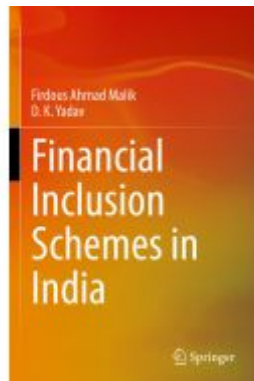
Financial Inclusion Schemes in India Ladenpreis: 120,99EUR