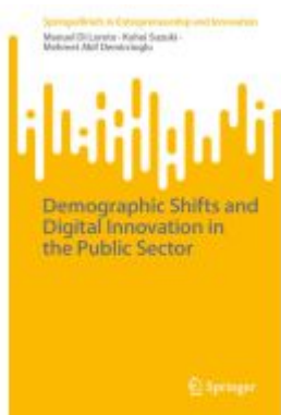
Demographic Shifts and Digital Innovation in the Public Sector Ladenpreis: 54,99EUR