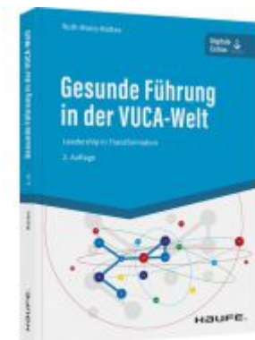
Gesunde Führung in der VUCA-Welt Ladenpreis: 41,10EUR

Wir haben andere Produkte gefunden, die Ihnen gefallen könnten!