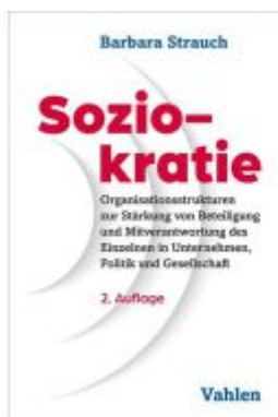
Soziokratie Ladenpreis: 35,90EUR