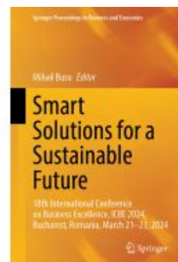
Smart Solutions for a Sustainable Future Ladenpreis: 219,99EUR