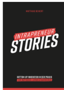
Intrapreneur Stories Ladenpreis: 26,99EUR