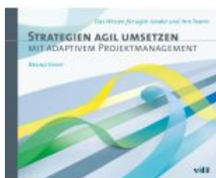
Strategien agil umsetzen mit adaptivem Projektmanagement Ladenpreis: 131,60EUR