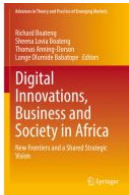
Digital Innovations, Business and Society in Africa