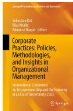
Corporate Practices: Policies, Methodologies, and Insights in Organizational Management