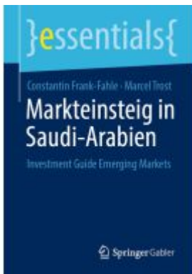
Markteinsteig in Saudi-Arabien