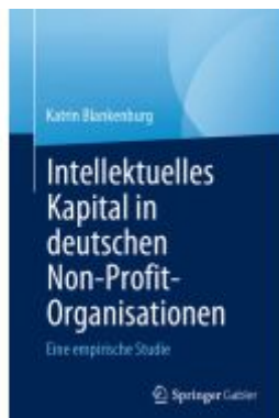
Intellektuelles Kapital in deutschen Non-Profit-Organisationen Ladenpreis: 82,23EUR