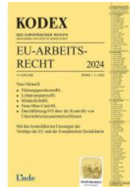
KODEX EU-Arbeitsrecht 2024 Ladenpreis: 72,00EUR