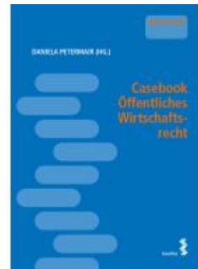
Casebook Öffentliches Wirtschaftsrecht Ladenpreis: 28,00EUR