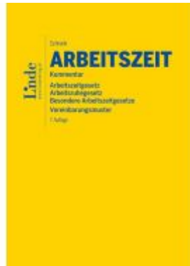
AZG | Arbeitszeitgesetz Ladenpreis: 225,00EUR