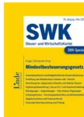
SWK-Spezial Mindestbesteuerung Ladenpreis: 40,00EUR