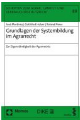
Grundlagen der Systembildung im Agrarrecht Ladenpreis: 74,10EUR