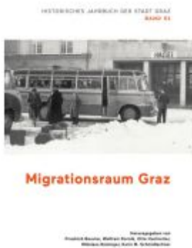
Migrationsraum Graz Ladenpreis: 29,00EUR