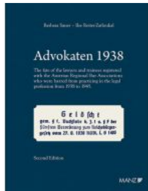
Advokaten 1938 English edition Ladenpreis: 78,00EUR