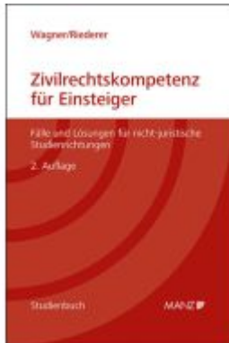
Zivilrechtskompetenz für Einsteiger Fälle und Lösungen für nicht-juristische Studienrichtungen Ladenpreis: 34,40EUR