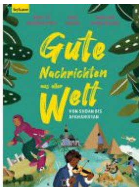
Gute Nachrichten aus aller Welt Ladenpreis: 24,50EUR