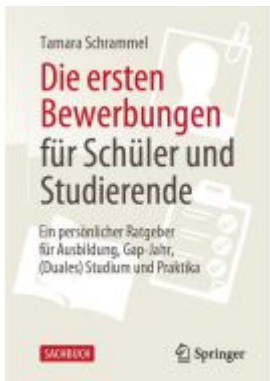
Die ersten Bewerbungen für Schüler und Studierende Ladenpreis: 18,49EUR

Wir haben andere Produkte gefunden, die Ihnen gefallen könnten!