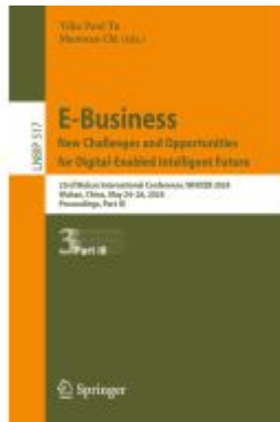
E-Business. New Challenges and Opportunities for Digital-Enabled Intelligent Future Ladenpreis: 142,99EUR