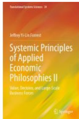
Systemic Principles of Applied Economic Philosophies II Ladenpreis: 164,99EUR