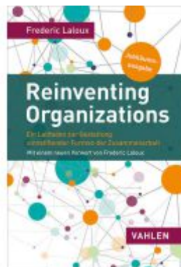
Reinventing Organizations Ladenpreis: 30,70EUR