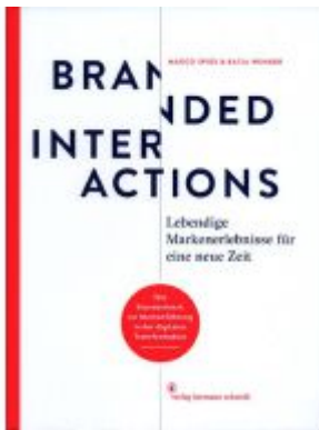
Branded Interactions Ladenpreis: 77,10EUR