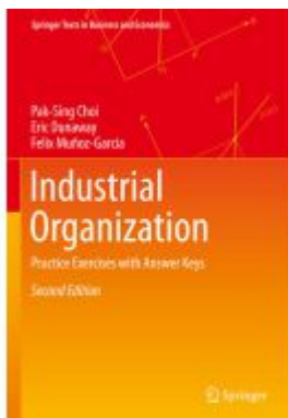
Industrial Organization Ladenpreis: 142,99EUR