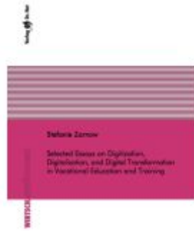
Selected Essays on Digitization, Digitalization, and Digital Transformation in Vocational Education and Training Ladenpreis: 86,40EUR