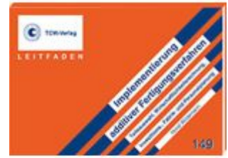
Leitfaden 3D Druck - Implementierung additiver Fertigungsverfahren Ladenpreis: 257,10EUR