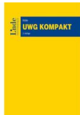
UWG kompakt Ladenpreis: 59,00EUR