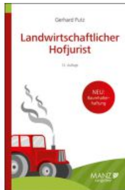
Landwirtschaftlicher Hofjurist Ladenpreis: 26,80EUR