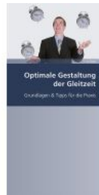
Optimale Gestaltung der Gleitzeit Ladenpreis: 16,50EUR