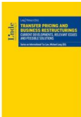
Transfer Pricing and Business Restructurings Ladenpreis: 45,00EUR