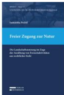
Freier Zugang zur Natur Ladenpreis: 79,00EUR