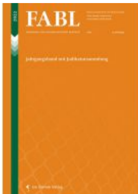
Fremden und Asylrechtliche Blätter (FABL) Ladenpreis: 72,00EUR