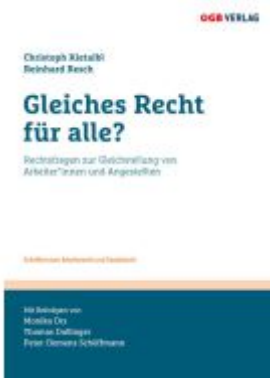
Gleiches Recht für alle? Ladenpreis: 29,90EUR