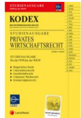
Kodex Privates Wirtschaftsrecht für die FH Wien der WKW - inkl. App Ladenpreis: 20,00EUR