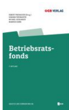
Betriebsratsfonds Ladenpreis: 36,00EUR