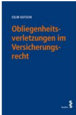
Obliegenheitsverletzungen im Versicherungsrecht Ladenpreis: 28,00EUR