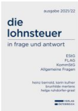
die lohnsteuer in frage und antwort Ladenpreis: 108,00EUR