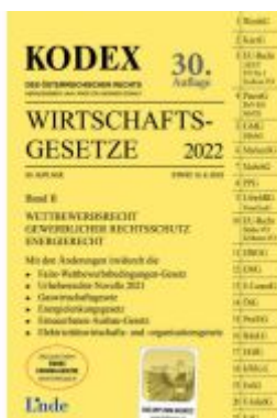
KODEX Wirtschaftsgesetze Band II 2022 Ladenpreis: 61,00EUR