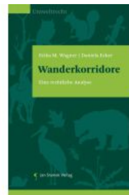
Wanderkorridore Ladenpreis: 49,90EUR