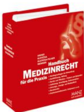
Handbuch Medizinrecht für die Praxis Ladenpreis: 198,00EUR