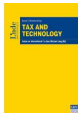
Tax and Technology Ladenpreis: 149,00EUR