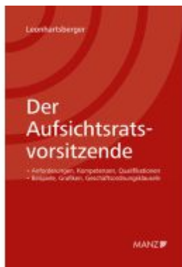
Der Aufsichtsratsvorsitzende Ladenpreis: 98,00EUR

Wir haben andere Produkte gefunden, die Ihnen gefallen könnten!