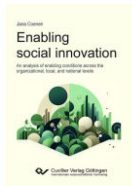
Enabling social innovation Ladenpreis: 61,60EUR