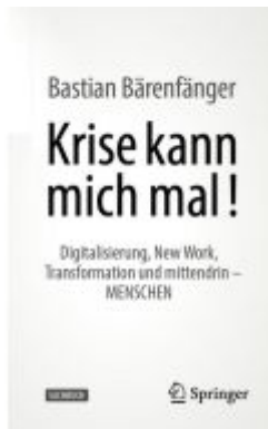
Krise kann mich mal! Ladenpreis: 28,77EUR