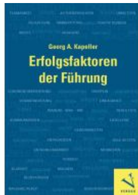
Erfolgsfaktoren der Führung Ladenpreis: 34,90EUR