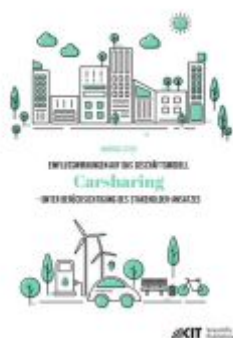
Einflusswirkungen auf das Geschäftsmodell Carsharing – unter Berücksichtigung des Stakeholder-Ansatzes Ladenpreis: 70,00EUR