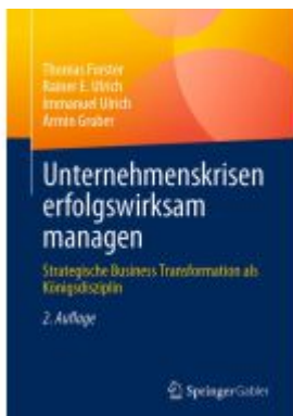
Unternehmenskrisen erfolgswirksam managen Ladenpreis: 56,53EUR

Wir haben andere Produkte gefunden, die Ihnen gefallen könnten!