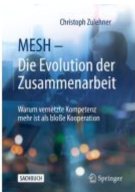
MESH – Die Evolution der Zusammenarbeit Ladenpreis: 30,83EUR