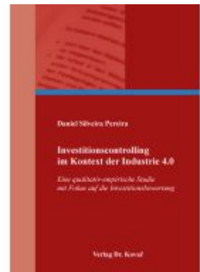
Investitionscontrolling im Kontext der Industrie 4.0 Ladenpreis: 102,60EUR