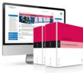
Der Instandhaltungs-Berater Ladenpreis: 459,80EUR