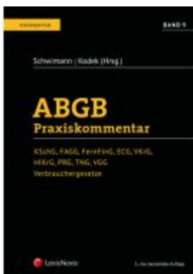
ABGB Praxiskommentar / ABGB Praxiskommentar - Band 9, 5. Auflage Ladenpreis: 239,00EUR