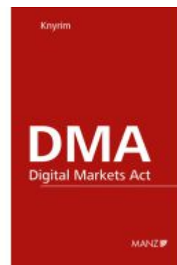
DMA - Digital Markets Act Ladenpreis: 34,00EUR