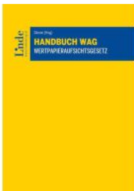
Handbuch WAG | Wertpapieraufsichtsgesetz Ladenpreis: 140,00EUR