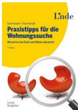
Praxistipps für die Wohnungssuche Ladenpreis: 29,90EUR

Wir haben andere Produkte gefunden, die Ihnen gefallen könnten!