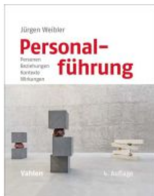
Personalführung Ladenpreis: 60,70EUR