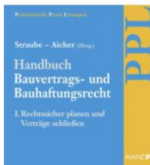
Handbuch Bauvertrags- und Bauhaftungsrecht Band I: Rechtssicher Planen Ladenpreis: 148,00EUR