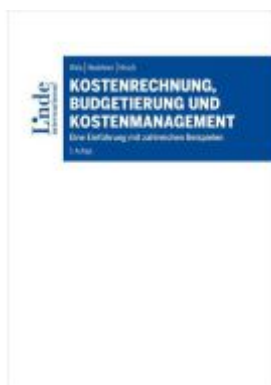
Kostenrechnung, Budgetierung und Kostenmanagement Ladenpreis: 72,00EUR