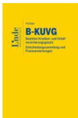
B-KUVG | Beamten-Kranken- und Unfallversicherungsgesetz - Entscheidungssammlung und Praxisanmerkungen Ladenpreis: 89,00EUR