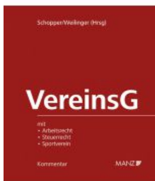
Vereinsgesetz Ladenpreis: 239,00EUR

Wir haben andere Produkte gefunden, die Ihnen gefallen könnten!