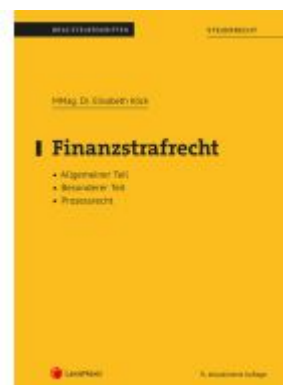
Finanzstrafrecht (Skriptum) Ladenpreis: 28,75EUR