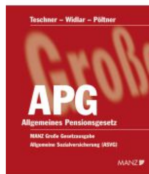
Allgemeines Pensionsgesetz Ladenpreis: 34,00EUR