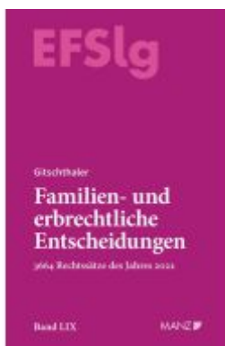
Familien- und erbrechtliche Entscheidungen EF-Slg Ladenpreis: 264,00EUR