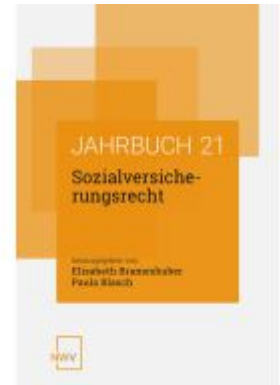
Sozialversicherungsrecht Ladenpreis: 62,00EUR