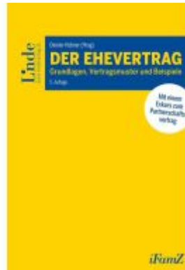
Der Ehevertrag Ladenpreis: 62,00EUR