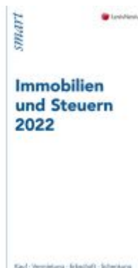
Immobilien und Steuern 2022 Ladenpreis: 12,00EUR