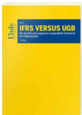
IFRS versus UGB Ladenpreis: 68,00EUR