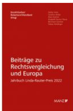
Beiträge zu Rechtsvergleichung und Europa Jahrbuch Linda-Rauter-Preis 2022 Ladenpreis: 89,00EUR