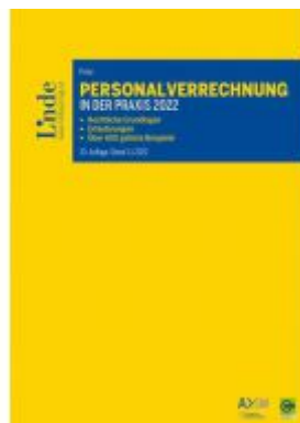
Personalverrechnung in der Praxis 2022 Ladenpreis: 110,00EUR