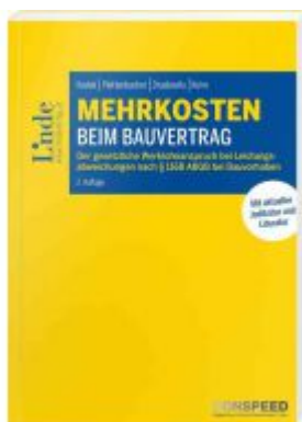
Mehrkosten beim Bauvertrag Ladenpreis: 62,00EUR