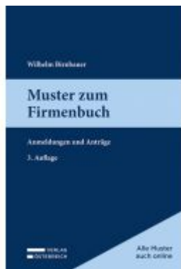
Muster zum Firmenbuch Ladenpreis: 69,00EUR

Wir haben andere Produkte gefunden, die Ihnen gefallen könnten!