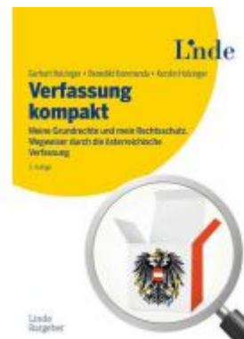
Verfassung kompakt Ladenpreis: 28,00EUR