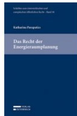
Das Recht der Energieräumplanung Ladenpreis: 109,00EUR