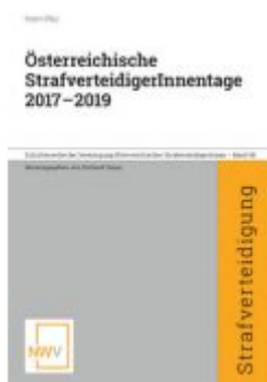
Österreichische StrafverteidigerInnenitage 2017 — 2019 Ladenpreis: 68,00EUR