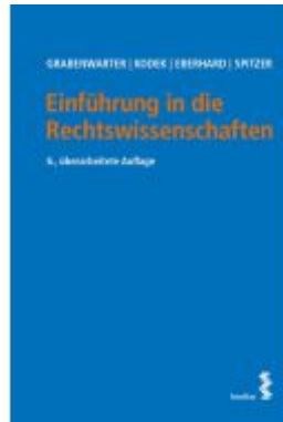
Einführung in die Rechtswissenschaften Ladenpreis: 22,00EUR