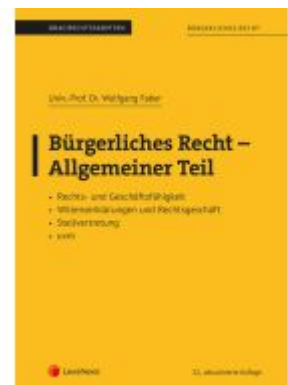
Bürgerliches Recht - Allgemeiner Teil (Skriptum) Ladenpreis: 26,25EUR

Alle Preise inkl. MwSt. zzgl. Versand. Bei Bestellung im LexisNexis Onlineshop kostenloser Versand innerhalb Österreichs.