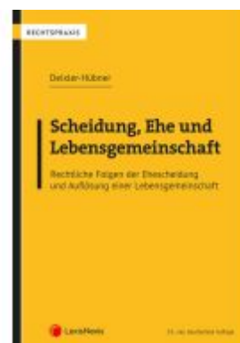
Scheidung, Ehe und Lebensgemeinschaft