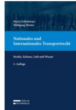
Nationales und Internationales Transportrecht Ladenpreis: 149,00EUR