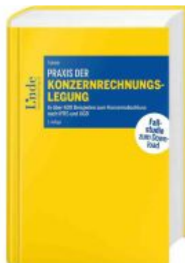
Praxis der Konzernrechnungslegung Ladenpreis: 178,00EUR