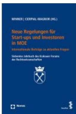
Neue Regelungen für Start-ups und Investoren in MOE