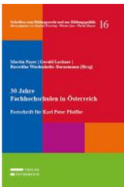
30 Jahre Fachhochschulen in Österreich Ladenpreis: 95,00EUR