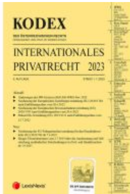
KODEX Internationales Privatrecht 2023 - inkl. App Ladenpreis: 37,00EUR

Wir haben andere Produkte gefunden, die Ihnen gefallen könnten!