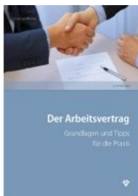
Der Arbeitsvertrag Ladenpreis: 33,00EUR