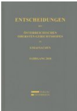
Entscheidungen des Österreichischen Obersten Gerichtshofes in Strafsachen Ladenpreis: 164,00EUR