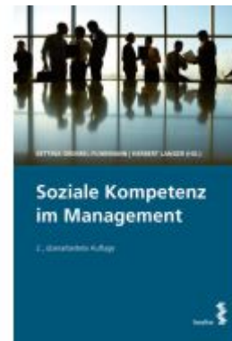
Soziale Kompetenz im Management Ladenpreis: 35,00EUR