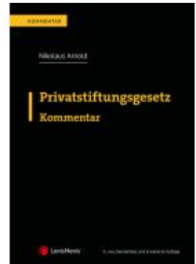
Privatstiftungsgesetz Ladenpreis: 239,00EUR