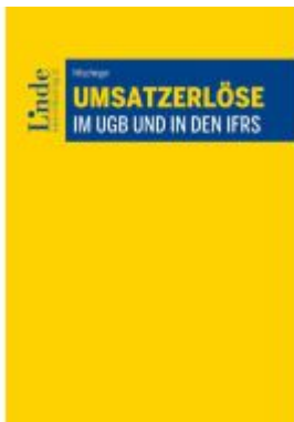
Umsatzerlöse im UGB und in den IFRS Ladenpreis: 78,00EUR

Wir haben andere Produkte gefunden, die Ihnen gefallen könnten!