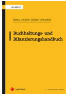
Buchhaltungs- und Bilanzierungshandbuch Ladenpreis: 86,00EUR