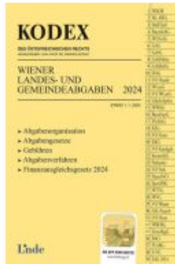
KODEX Wiener Landes- und Gemeindeabgaben Ladenpreis: 29,00EUR