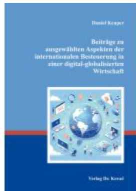
Beiträge zu ausgewählten Aspekten der internationalen Besteuerung in einer digital-globalisierten Wirtschaft Ladenpreis: 143,80EUR