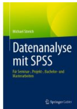
Datenanalyse mit SPSS Ladenpreis: 41,11EUR