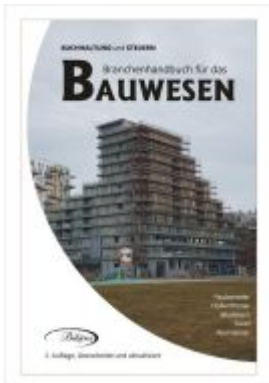
BAUWESEN Ladenpreis: 74,80EUR