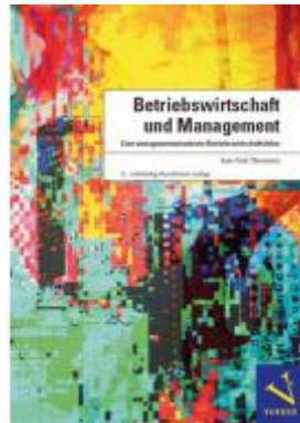
Betriebswirtschaft und Management Ladenpreis: 98,00EUR