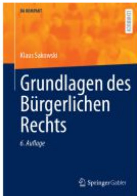
Grundlagen des Bürgerlichen Rechts Ladenpreis: 56,53EUR