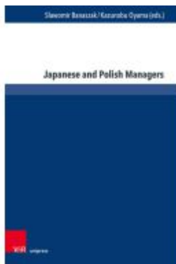
Japanese and Polish Managers Ladenpreis: 42,00EUR