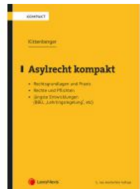
Asylrecht kompakt Ladenpreis: 34,00 EUR