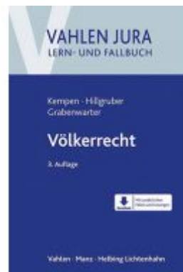
Völkerrecht Ladenpreis: 35,90 EUR