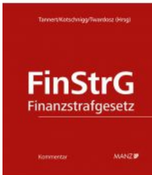
Finanzstrafgesetz Ladenpreis: 328,00 EUR