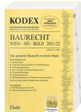
KODEX Baurecht Wien - NÖ - Bgld 2021/22 Ladenpreis: 65,00 EUR