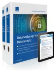
Unterweisungs-Vorlagen Datenschutz Ladenpreis: 207,90 EUR