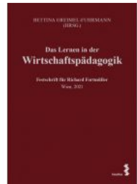
Das Lernen in der Wirtschaftspädagogik Ladenpreis: 34,00 EUR