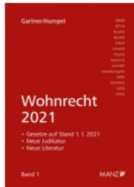
Wohnrecht 2021 Ladenpreis: 44,00 EUR