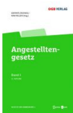
Angestelltengesetz Ladenpreis: 98,00 EUR

Wir haben andere Produkte gefunden, die Ihnen gefallen könnten!