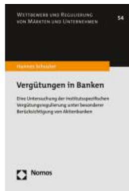
Vergütungen in Banken Ladenpreis: 132,70EUR