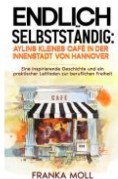
Endlich selbstständig: Aylins kleines Café in der Innenstadt von Hannover Ladenpreis: 14,40EUR