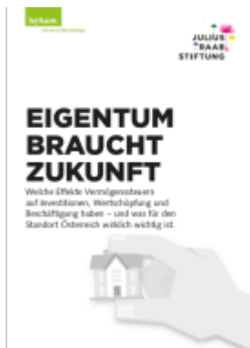
EIGENTUM BRAUCHT ZUKUNFT Ladenpreis: 35,00EUR

Wir haben andere Produkte gefunden, die Ihnen gefallen könnten!