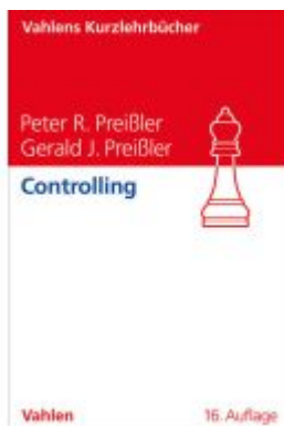
Controlling Ladenpreis: 35,90EUR