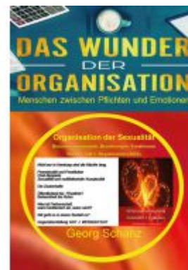
Das Wunder der Organisation - Band 5 Ladenpreis: 50,40EUR