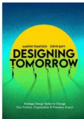
Designing Tomorrow Ladenpreis: 29,99EUR