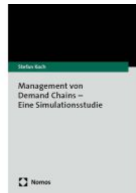
Management von Demand Chains – Eine Simulationsstudie Ladenpreis: 40,10EUR