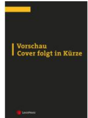
Die neue Verbandsklage Ladenpreis: 35,00EUR