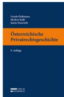
Österreichische Privatrechtsgeschichte Ladenpreis: 56,00EUR