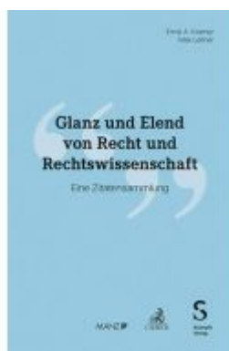
Glanz und Elend von Recht und Rechtswissenschaft Ladenpreis: 40,00EUR