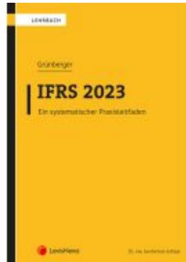
IFRS 2023 Ladenpreis: 48,00EUR