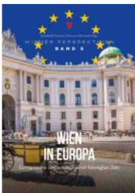
Wien in Europa Ladenpreis: 29,90EUR