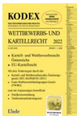
KODEX Wettbewerbs- und Kartellrecht 2022 Ladenpreis: 67,00EUR