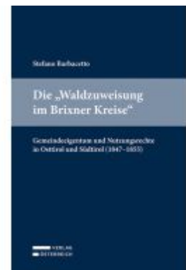
Die "Waldzuweisung im Brixner Kreise" Ladenpreis: 35,00EUR