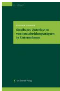
Strafbares Unterlassen von Entscheidungsträgern in Unternehmen Ladenpreis: 74,00EUR