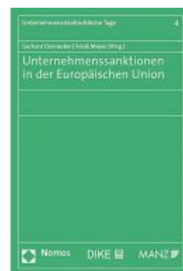
Unternehmenssanktionen in der Europäischen Union Ladenpreis: 65,79EUR