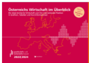
Österreichs Wirtschaft im Überblick 2023/24 Ladenpreis: 16,50EUR