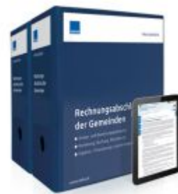
Rechnungsabschluss der Gemeinden Ladenpreis: 261,80EUR