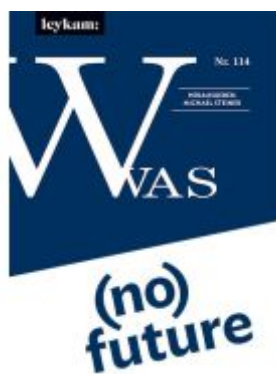
WAS – (no) future Ladenpreis: 19,00EUR