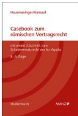
Casebook zum römischen Vertragsrecht Ladenpreis: 44,40EUR