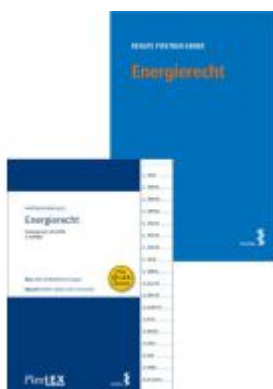
Kombipaket Energierecht und FlexLex Energierecht Ladenpreis: 48,00EUR