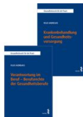
Kombipaket Verantwortung im Beruf – Berufsrechte der Gesundheitsberufe sowie Krankenbehandlung und Gesundheitsversorgung Ladenpreis: 59,00EUR