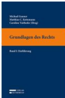
Grundlagen des Rechts Ladenpreis: 34,00EUR