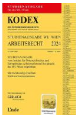
KODEX Studienausgabe Arbeitsrecht WU 2024 Ladenpreis: 15,00EUR