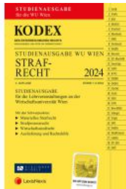
KODEX Strafrecht für die WU 2024 - inkl. App Ladenpreis: 19,00EUR