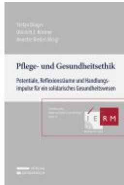
Pflege- und Gesundheitsethik Ladenpreis: 59,00EUR