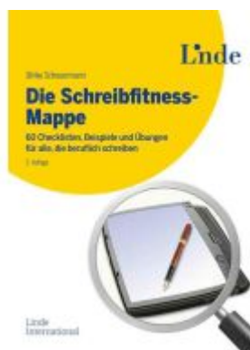
Die Schreibfitness-Mappe Ladenpreis: 22,00EUR