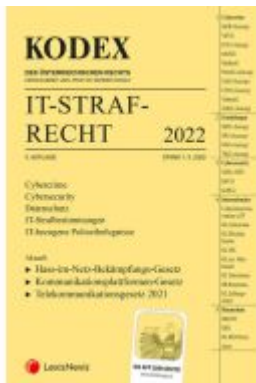
KODEX IT-Strafrecht 2022 - inkl. App Ladenpreis: 30,00EUR