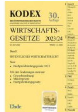
KODEX Wirtschaftsgesetze Band I 2023/24 Ladenpreis: 62,00EUR