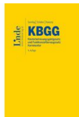
KBGG | Kinderbetreuungsgeldgesetz und Familienzeitbonusgesetz Ladenpreis: 54,00EUR