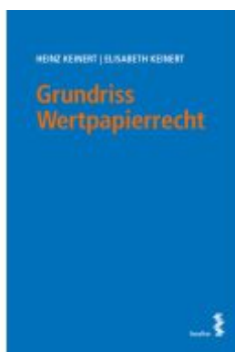
Grundriss Wertpapierrecht Ladenpreis: 26,00EUR