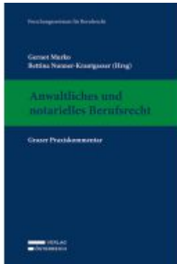
Anwaltliches und notarielles Berufsrecht Ladenpreis: 389,00EUR