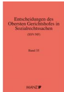
Entscheidungen des obersten Gerichtshofes in Sozialrechtssachen SSV-NF Ladenpreis: 143,90EUR