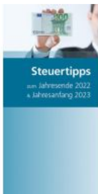
Steuertipps zum Jahresende 2022 & Jahresanfang 2023 Ladenpreis: 14,00EUR