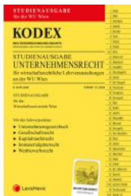
KODEX Unternehmensrecht für wirtschaftsrechtliche LVA 2024 - inkl. App Ladenpreis: 26,00EUR