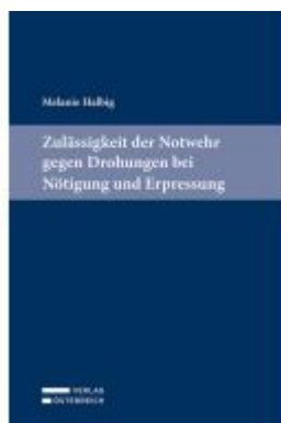
Zulässigkeit der Notwehr gegen Drohungen bei Nötigung und Erpressung Ladenpreis: 89,00EUR