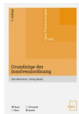
Grundzüge der Insolvenzordnung Ladenpreis: 20,00EUR