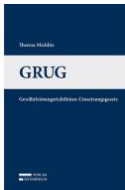
GRUG Ladenpreis: 39,00EUR