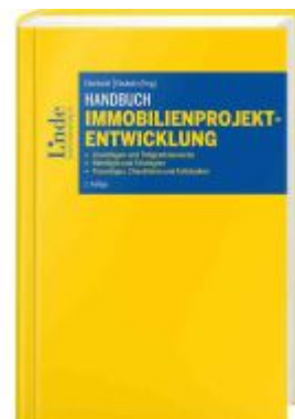
Handbuch Immobilienprojektentwicklung Ladenpreis: 108,00EUR