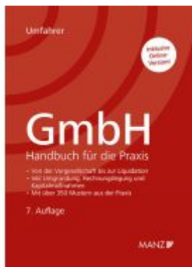
GmbH - Handbuch für die Praxis Ladenpreis: 278,00EUR