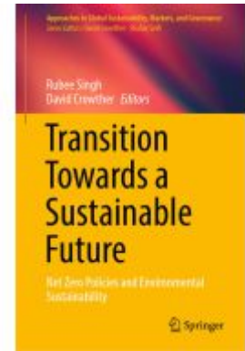
Transition Towards a Sustainable Future Ladenpreis: 197,99EUR