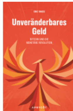
Unveränderbares Geld Ladenpreis: 25,70EUR