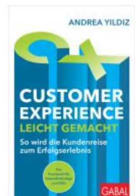
Customer Experience leicht gemacht Ladenpreis: 28,80EUR