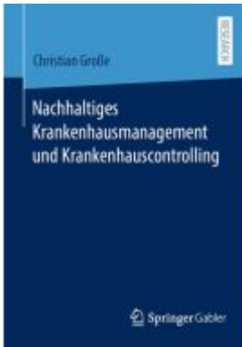
Nachhaltiges Krankenhausmanagement und Krankenhauscontrolling Ladenpreis: 77,09EUR