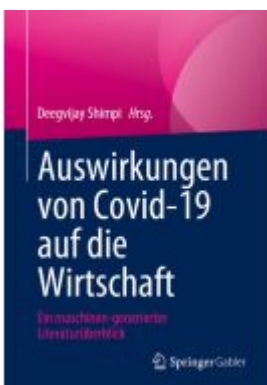
Auswirkungen von Covid-19 auf die Wirtschaft Ladenpreis: 61,68EUR