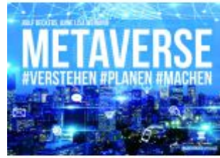
METAVERSE Ladenpreis: 41,10EUR