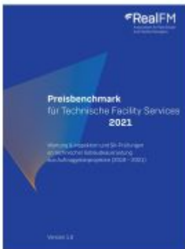
Preisbenchmark für Technische Facility Services 2021 Ladenpreis: 421,30EUR